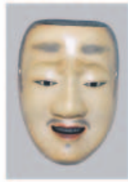
中尉 境 和義 福岡県

作りは良く、顔の表情はいいのですが、彩色が薄い、この彩色では舞台上で使う気がしなくなる、もっと自然な感じの彩色が必要ですが、おしい作品です。