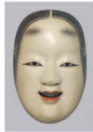
小面 恵美 みわ子 兵庫県

現代もののツレ面として舞台上で使えます。小面らしい可愛さがあり、色・表情はできています。しかし、顔の感じがなく、若干目が大きい、角度を減らすと表情が遠くなる弱さがあります。良くできています。